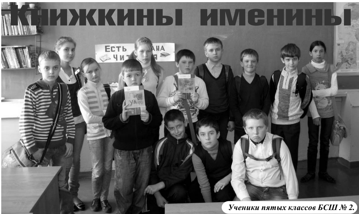
Ученики пятых классов БСШ № 2.

2 АПРЕЛЯ – МЕЖДУНАРОДНЫЙ ДЕНЬ ДЕТСКОЙ КНИГИ